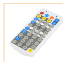
RF-HBP3 - pilot sterujący do oprawy z czujnikiem ruchu

Możliwość zamówienia oprawy z mikrofalowym czujnikiem ruchu oraz pilotem sterującym.