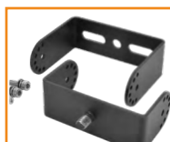
Opcjonalne uchwyty do montażu ściennego Optional brackets for wall montage C85-UM-HB-M10