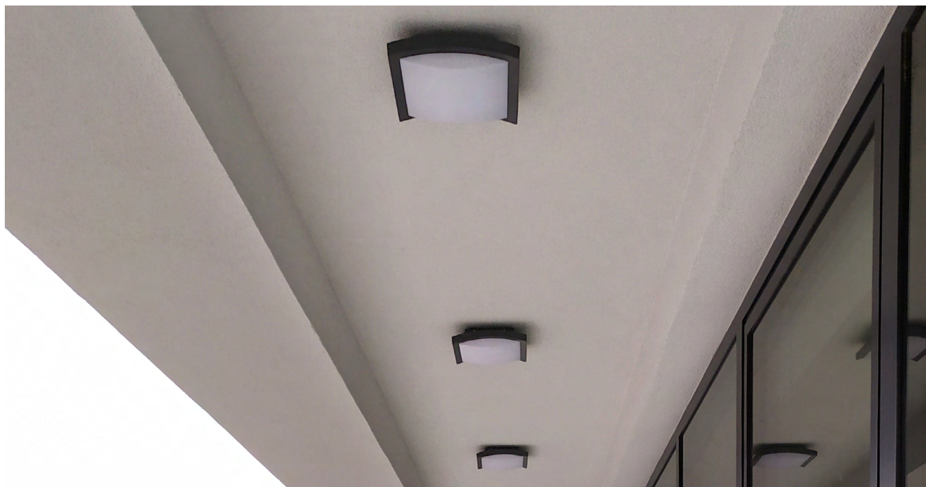
Diody z soczewkami (EL1-R-020GR) Diodes with lenses (EL1-R-020GR)